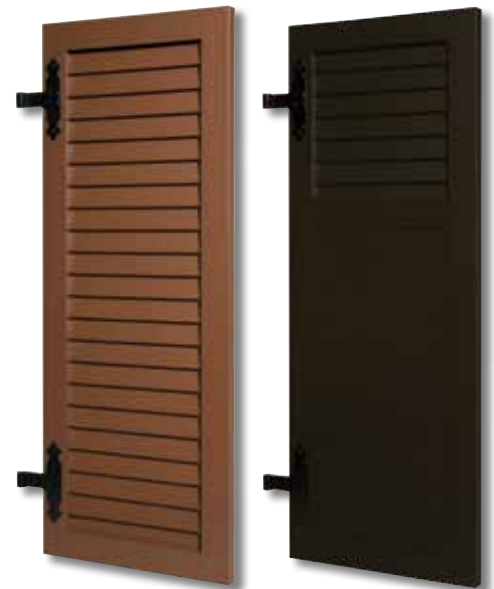
Type 002 Ajouré toute hauteur Rouille