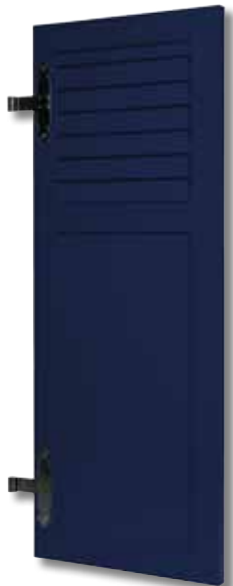
Type 132 1/3 haut ajouré Panneau lisse Bleu G5003