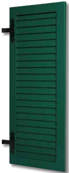
Type 001 Persienne américaine Sans ajour toute hauteur Vert G6005