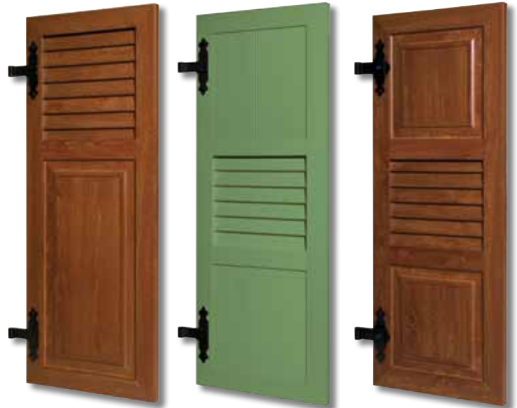
Type 142 1/3 haut ajouré Plat de bande Chêne or