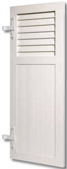
Type 112 1/3 haut ajouré Planchette verticale Blanc G9016