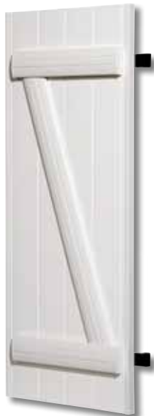
Type 320 Plein à barres Blanc G9016